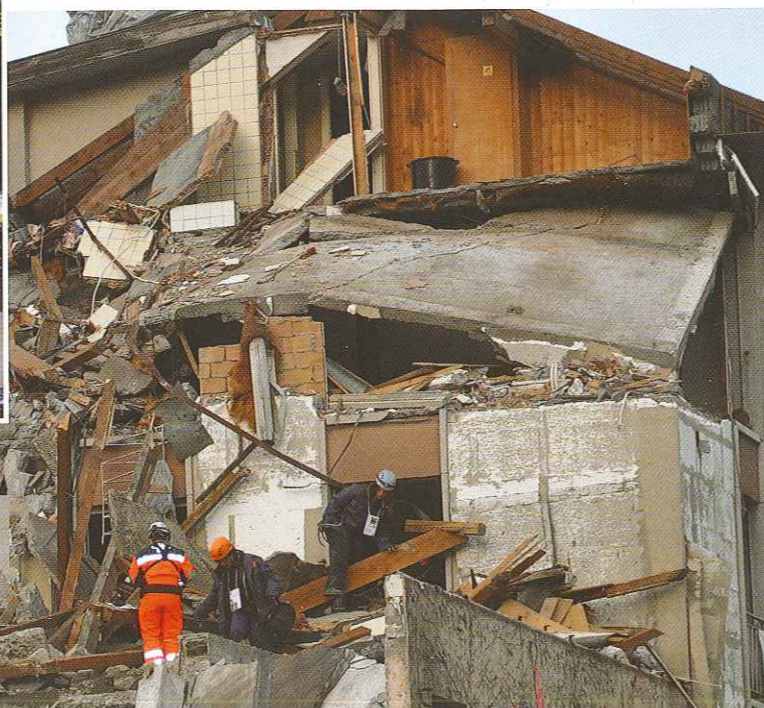
Martigny Exercice SRM SRM Einsatzübung

REDOG «Schweizerischer Verein Such- und Rettungshunde». Wir sind eine gemeinnützige, humanitäre Freiwilligenorganisation, die Rettungshunde für die Trümmer-, Gelände- und Spurensuche (Trail) sowie Spezialisten für die Technische Ortung ausbildet und zur Verfügung stellt. Wir haben über 40 Jahre Einsatzerfahrung - über 70 Einsätze im Inland (z.B. Gondo, Sembrancher) und im Ausland (z.B. Sumatra, Japan). Bei diesen Einsätzen kann-