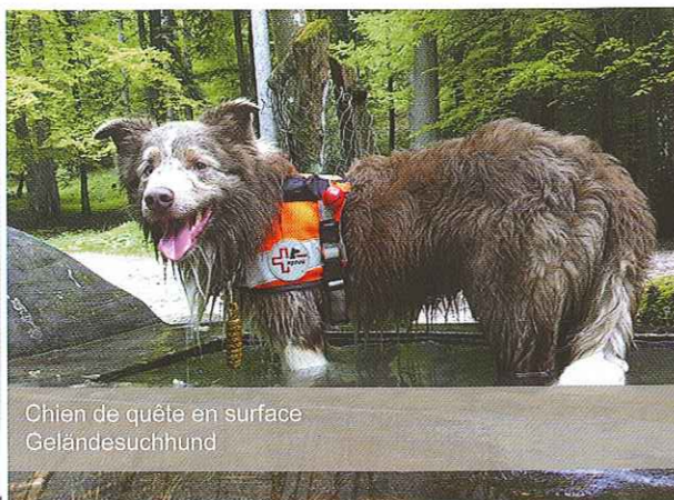
Chien de quête en surface Geländesuchhund

REDOG « Société suisse pour chiens de recherche et de sauvetage ». Nous sommes une organisation humanitaire sans but lucratif qui forme des chiens de sauvetage pour des personnes ensevelies sous les décombres, la recherche en surface et de piste (trail), ainsi que des