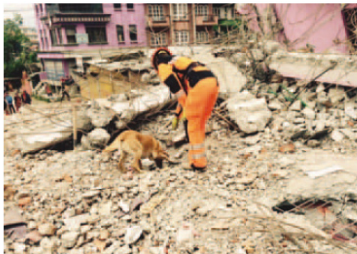
L'équipe de Redog n'a malheureusement pu trouver aucun survivant.

Le Valaisan se souviendra également longtemps de ses contacts avec les Népalais survivants pendant ces quelques jours dans