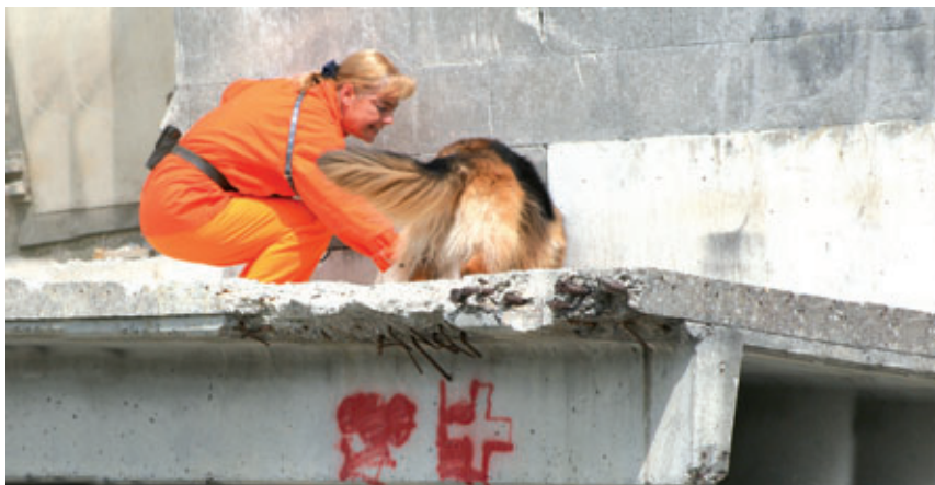
Zuverlässig lokalisieren REDOG-Katastrophenhunde unter Trümmern verschüttete Menschen.

Bei REDOG steht das Tier im Mittelpunkt – genauso bei VIRBAC, dem einzigen Unternehmen weltweit, das sich ausschliesslich mit Veterinärmedizin beschäftigt. Eine Partnerschaft ist daher nahe liegend: Aus jeder verkauften Packung FORTIFLEX fliesst ein festgesetzter Betrag an REDOG – mit jedem Kauf unterstützen Sie also die Arbeit der Rettungshunde! Ausserdem stellt VIRBAC den Hunden der Nationalmannschaftsmitglieder die Mobility-Kautablette FORTIFLEX zur Verfügung: Denn neben einer guten Spürnase braucht ein Rettungshund auch gesunde, starke Gelenke!