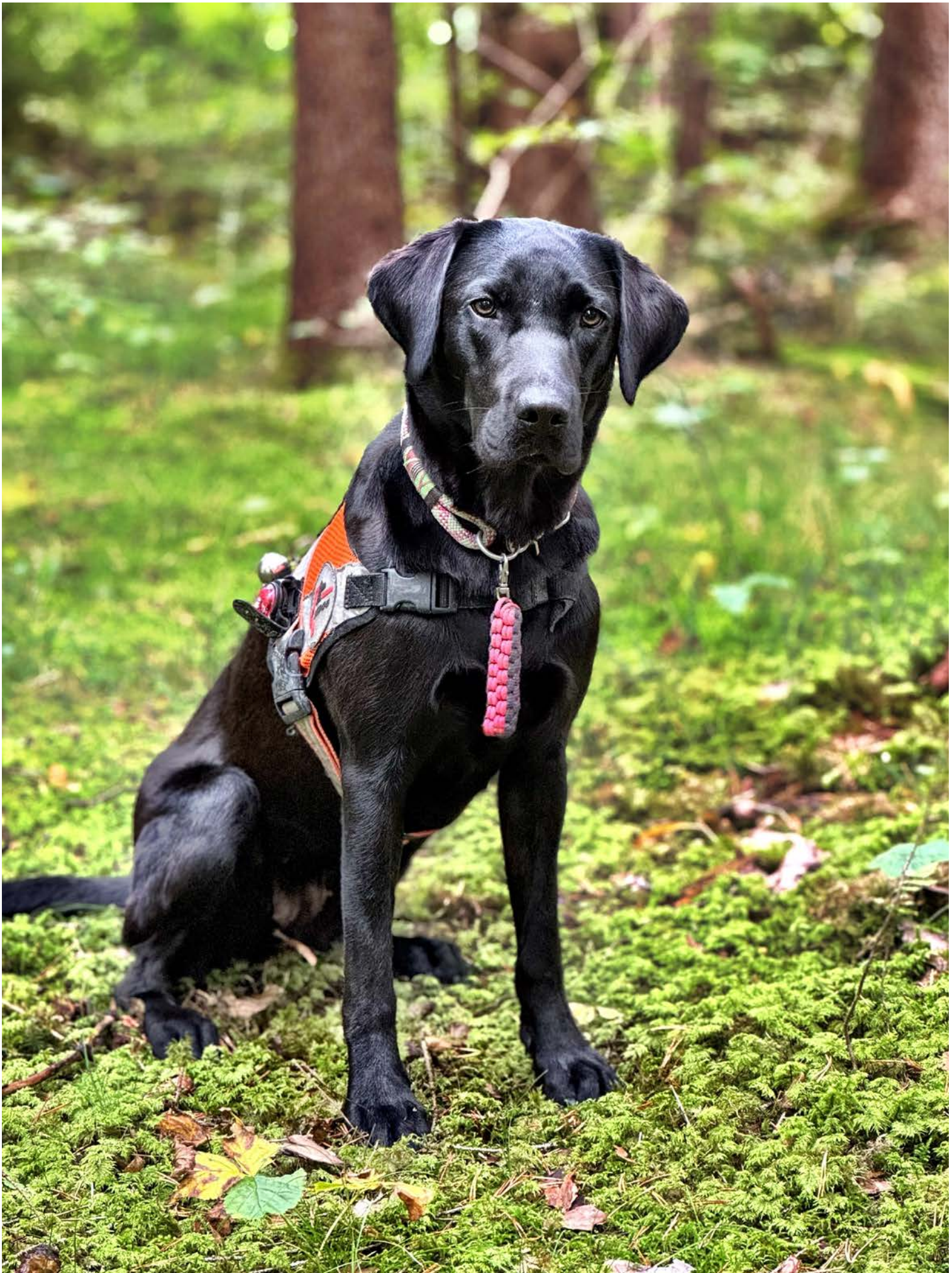
Die Ausbildung eines Rettungshundes ein jahrelanger Prozess, geprägt von Trainingseinheiten, Prüfungen und realitätsnahen Übungen.